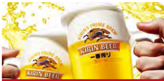
《プラン特典》会場使用料(2時間)サービス